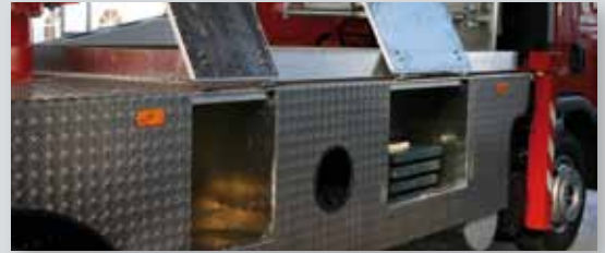
... SICHER & ATTRAKTIV!