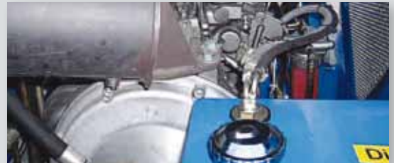
... SPARSAM & UMWELTFREUNDLICH!