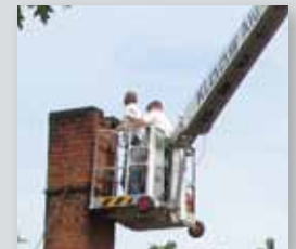
... CLEVER & FLEXIBEL!