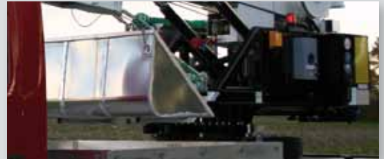
... PRAKTISCH & VARIABEL!