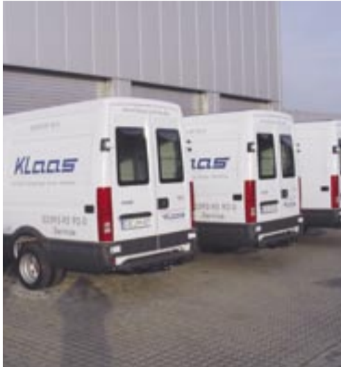
Nach Absprache mit unserem Serviceteam ist eine Abhol- und Rückgabezeit flexibel wählbar.

Klaas ist nicht nur Hersteller von Dachdeckerkränen und -aufzügen sowie Möbelaufzügen , sondern deckt gleichermaßen die Bedarfe des Handwerks an Mietgeräten ab. Vor allem Dachdecker, Zimmerleute, Hallen- und Stahlbauer sowie Umzugsunternehmen wissen den Mietservice von Klaas angefangen bei Kränen mit einer Tragkraft von 500 bis 2.000 kg bis hin zu Dachdecker- oder Möbelaufzügen mit Traglasten zwischen 200 bis 400 kg für kurze oder auch dauerhafte Einsätze zu schätzen. Denn durch den Einsatz eines Kranes oder Aufzuges kann Personal und Zeit eingespart werden. So kann die Arbeit effizienter und für den Kunden günstiger ausgeführt werden. Oft werden mit Hilfe eines Klaas Mietgerätes Auftragspitzen bewältigt ohne zusätzliches Personal einzustellen oder die Aufträge absagen zu müssen. Darüber hinaus nutzen Kunden den Mietservice auch bei anfallenden Reparatur- oder Wartungsarbeiten am eigenen Gerät, so dass keine Ausfallzeiten auftreten.