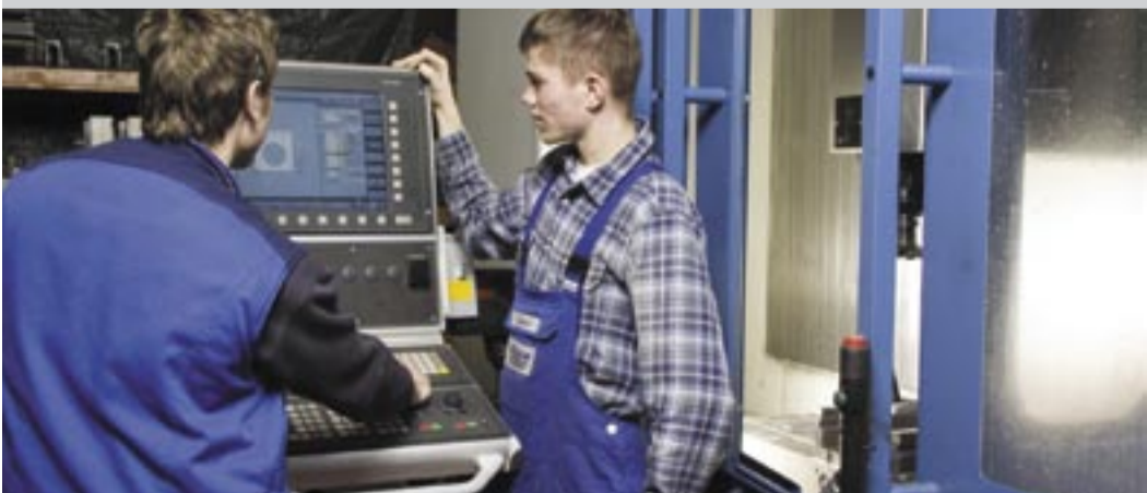
Einweisung eines Lehrlings auf ein CNC-Bearbeitungszentrum